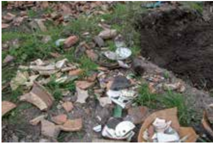
Schervenhopen op de afvalplaats achter de Wolvetintje

Het vondstmateriaal beslaat de periode 1740, het jaar dat de boerderij gebouwd werd, tot 1865, het jaar dat de boerderij werd verlaten en afgebroken. De vele artefacten, onder andere aardewerk, glas en leer, geven een goede indruk van de levensstijl van de bewoners en geconcludeerd kan worden dat hier aan de Fluessen welgestelde boeren hebben gewoond.