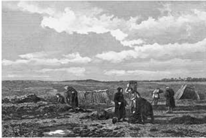
Monniken ontginnen het veengebied.

ongeveer de 10e tot de 13e eeuw trokken kolonisten het veengebied in het Fluessendal binnen en groeven afwateringssloten om het land droog te leggen en geschikt te maken voor landbouw. De ontginningspatronen in het veen en de daarin aangetroffen scherven