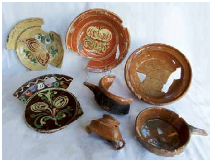
19e-eeuws gebruiks aardewerk uit De Wolvetinte

In de nieuwe woonfase van De Wolvetinte komen we wederom roodbakkend aardewerk uit Friesland en Bergen op Zoom tegen. Een nieuwe categorie witbakkend aardewerk betreft rood, geel en bruin beschilderde borden uit het Nederrijn gebied in Duitsland. In het plaatsje Frechen werden veel van dit soort borden geproduceerd. De vrij grote borden zijn versierd met een florale decoratie. Op een aantal randen van de