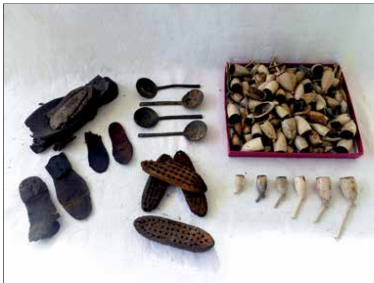
Leer, lepels en pijpenkoppen gevonden in de Wolvetinte

we houten borstels, leren schoenzolen en tinnen lepels tegen. De schoenzolen hebben verschillende maten: er zijn zowel kinderzooltjes als mannen- en vrouwenzolen gevonden. Opvallend is, dat dit de enige voorwerpen zijn naast het aardewerk en het glas. Er zijn verder geen metalen pannen of onderdelen van lampen en kandelaars gevonden. Ook troffen we geen sieraden of geld aan.