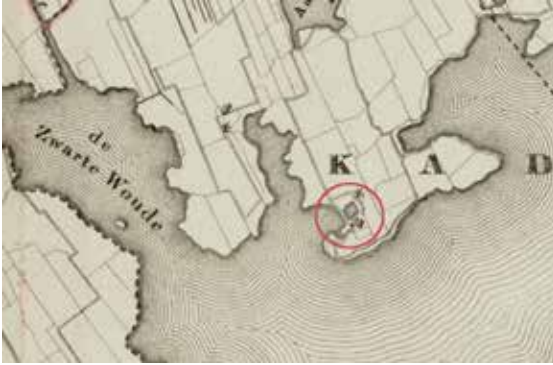
Kadasterkaart uit de Atlas van Eekhoff, 1849-1859. De boerderij De Wolwetinte is rood omcirkeld..