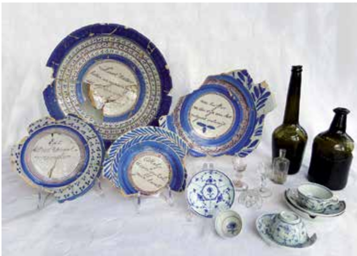
Vroeg 19e-eeuws sieraardewerk en drinkgerei uit De Wolvetinte

De borden zijn vrijwel allemaal beschilderd met blauwe en paarse verf. Enkele exemplaren bevatten ook gele beschilderingen. De teksten doen zeer stichtelijk aan. Enkele voorbeelden zijn: 'Help dien gij helpen kunt', 'Eet met smaak vrienden', 'Wie leeft er nu ter tijd die het welgaat onbenijd', 'Laat haters haten en nijders nijden, dat God ons gunt moet ieder lijden', en 'De mond der goddelozen spreekt bedrog'. Uit de teksten kunnen we opmaken dat de bewoners een religieuze achtergrond hadden. Uit historische bronnen weten we dat de familie de Wolff rooms-katholiek