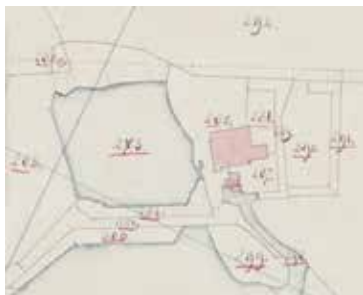
Plattegrond van de Wolvetinte met vijver en insteekhaven, detail kadasterkaart 1811-1832

Op de zuidelijke punt van It Skar op de hoek van de Zwarte Woude en de Fluessen vond ik de contouren van een boerderij. Door kleurverschillen in de veenlaag konden de sporen van de fundering getraceerd worden. Het is bekend dat de boerderij De Wolvetinte in deze hoek heeft gestaan. De boerderij werd aan de kant van de Zwarte Woude beschermd door een hoge dijk, die nog steeds aanwezig is. De Wolvetinte had een eigen insteekhaven en lag strategisch ten opzichte van de Fluessen en Gaasterland. Het voorhuis lag naar de Fuessen toegekeerd. De hele plattegrond had een breedte van 22 meter en een lengte van 35 meter. De locatie werd verduidelijkt door twee stenen putten en een grote afvalplaats van gebruiksmateriaal. Dat gebruiksmateriaal werd vooral gevonden in wat eens een grote vijver achter de boerderij was en waarbij ook een watermolen stond.