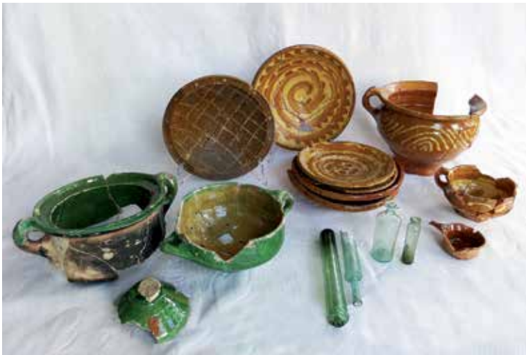
18e-eeuws gebruiks aardewerk en glas uit De Wolvetinte

In de 18e eeuw zijn er een aantal centra waar dit aardewerk werd geproduceerd. In Nederland waren de grootste productiecentra Brabant - met name Bergen op Zoom en Oosterhout - Gouda en verschillende plaatsen in Friesland, waarvan Workum nog steeds zeer bekend is. Verder kwam er een grote stroom aan geïmporteerd materiaal uit de Duitse Niederrhein. Vanaf de 17e eeuw werd er al veel roodbakkend aardewerk vanuit het Duitse Nederrijn gebied over de Rijn en de IJssel naar Noord- en West-