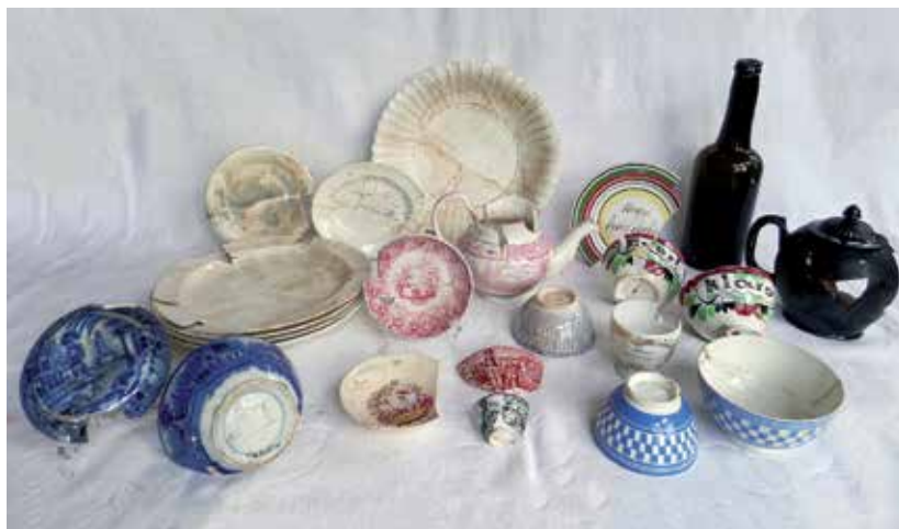
Midden 19e-eeuws eet-en drinkgerei uit De Wolvetinte

Vanaf de jaren '30 van de 19e eeuw begon men in Maastricht ook industrieel wit aardewerk te produceren. De fabriek van Petrus Regout was de eerste in Nederland die zich specialiseerde in dit type aardewerk. Hoewel nog vele producten uit Engeland in Nederland ingevoerd werden, troffen we ook voorwerpen uit Maastricht bij De Wolvetinte aan. Sommige objecten zijn gemerkt met 'P. Regout'. Er zijn echter ook nog producten uit Engeland waar te nemen. Zo is er bijvoorbeeld een schoteltje met de tekst 'Mijn brave dochter', een wat aparte Nederlandse tekst zou men denken. Als we echter de schotel omdraaien, valt het merk 'Dawson' op. Dit was een Engels productiecentrum. Het schoteltje is dan ook bedoeld geweest voor de Nederlandse markt. Waarschijnlijk dacht de pottenbakker dat het Engelse 'brave' (dapper) in het