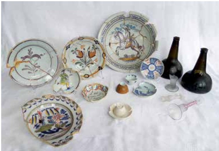
18e eeuwse sieraardewerk en drinkgerei uit De Wolvetint

Een geheel andere categorie aardewerk, die evenwel van dezelfde klei gemaakt werd, is het zogenaamde tinglazuur aardewerk. In tegenstelling tot het gebruiks aardewerk omvat deze materiaal categorie voornamelijk borden en kommen voor de pronk. Dit over het algemeen prachtig versierde aardewerk onderscheidt zich in twee soorten die elk een iets andere manier van produceren kennen: het majolica en het faience. Majolica verschilt van het faience, doordat het alleen aan de bovenzijde van wit tinglazuur voorzien is, terwijl faience aan beide zijden met tinglazuur is bedekt. Majolica is