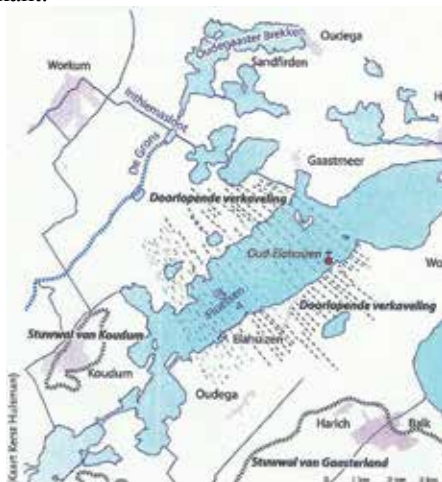
Ontginningspatronen lopen onder de Fluessen door vanuit It Heidenskip tot aan Gaasterland.

Het verhaal van dit landschap begon in de ijstijden. Gletsjers zetten grote hoeveelheden steen en keileem af - de stuwwallen van Gaasterland - en schuurden een langgerekte laagte uit, waar tegenwoordig het Heegermeer, de Fluessen en de Morra in liggen. Na de Kwartaire ijstijden begon in de uitgeschuurde laagte veenvorming te ontstaan. Daardoor lag er hier zo'n duizend jaar geleden een uitgestrekt, meters dik veenpakket uitlopend naar de zandgronden van Gaasterland aan de ene kant en naar de kleigronden aan de andere kant.