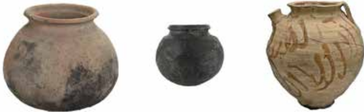
Voorbeelden van een kogelpot, een Paffrathpot en een schenkan uit Pingsdorf

Beide soorten aardewerk heb ik alleen in Stavoren en omgeving gevonden. Het kwam vermoedelijk over de IJssel via Deventer naar deze streken.