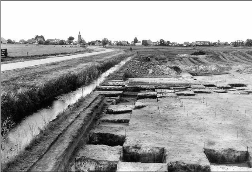
Een opgraving van een neolithisch kampement bij Warns, eind jaren 60 - begin jaren 70 van de vorige eeuw