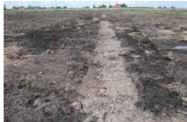
Verstorings in het veen.

Er waren in het afgegraven land in de zwarte veengrond lange geelgrijze, evenwijdig lopende banen te zien, die wezen op door mensenhanden gegraven greppels of sloten, verkavelingspatronen zo je wil. Deze structuur werd soms onderbroken door rechthoekige patronen, waarin verspreid hopen scherven lagen. Hoe moet men dergelijke structuren op deze plek interpreteren?