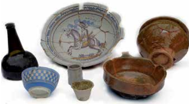
Vondsten bij De Wolvetintje uit de 18e en 19e eeuw

Het vondstmateriaal beslaat de periode 1740, het jaar dat de boerderij gebouwd werd, tot 1865, het jaar dat de boerderij werd verlaten en afgebroken. De vele artefacten, onder andere aardewerk, glas en leer, geven een goede indruk van de levensstijl van de bewoners en geconcludeerd kan worden dat hier aan de Fluessen welgestelde boeren hebben gewoond.