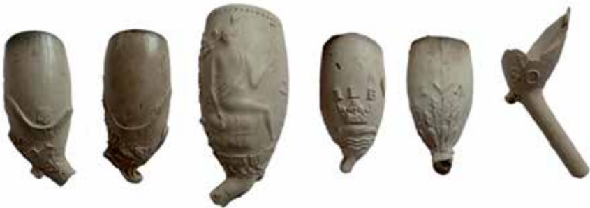
18e- en 19e-eeuwse fraai versierde pijpenkoppen

Een aantal pijpen is mooi versierd. Zo zien we twee 18e-eeuwse ‘snoeken-ofvissenbekken’,