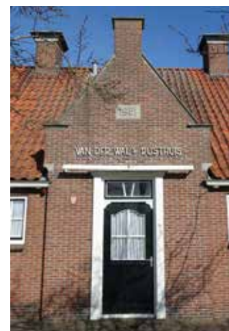
Links: Ingang naar de regentenkamer

Aanvragers van een subsidie moeten een redelijke begroting en rekening overleggen en eerst elders (gemeente) proberen subsidie te bemachtigen. De stichting functioneert zo nodig als sluitpost.