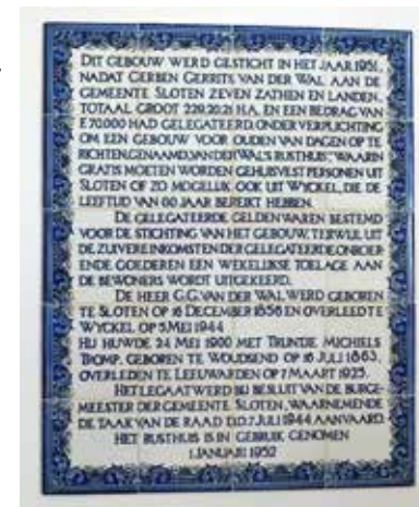
Plaquette in de hal van het rusthuis