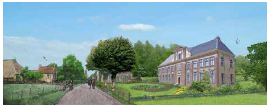
Zo heeft Beuckenswijk er ongeveer uit gezien, zie www.riedo.nl

Indien bijzondere omstandigheden niet verplichten van Sondel oostwaarts naar Takozijl en de Lemmer , of noordwaarts naar Wijkel te rijden, zoo vervolgen wij ons reisplan door aan de westzijde van Sondel regtsaf over de bouwlanden, of langs den tweeden weg, boschwaarts te gaan, ten einde, door den langen eiken- en dennenlaan, het diep in het woud gelegene, onbewoonde Lijcklama-bosch te bezoeken; verder voorbij