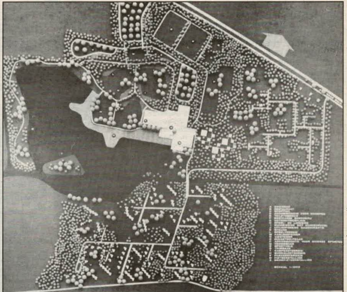
Planindeling voor Wyldemerk in 1972, zo Ingenieursbureau Oranjewoud en architectenbureau Groenewoud en Sipma dat in elkaar zetten.