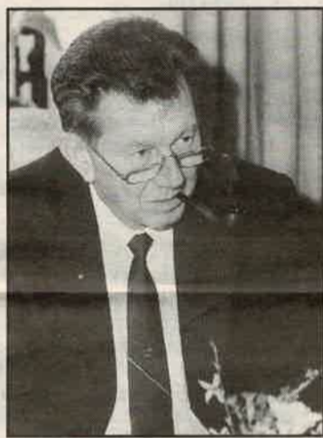
KLAAS DE GROOT (foto Archief: BC).

"De geplande sporthal, het zwembad en de verdere sportaccommodaties leverde ons bijna 3000 adhesiebetuigingen op vanuit de sportwereld. Het was logisch dat B en W voor de volle honderd procent achter het plan ging staan". Hoewel uit de ruim 2000 bezwaarschriften bleek dat er ook veel tegenstand was, werd het plan toch aan de raad voorgelegd. "Onder die bezwaarschriften zaten honderden van leerlingen uit Sneek, die een voorgedrukt pamflet hadden ondertekend. Maar ook kinderen van vier jaar bleken tegen en zelfs ontdekten we een bezwaarschrift van mijzelf, compleet met vervalste handtekening. Van die 2000 bleef minder dan de helft over die serieus konden worden genomen".